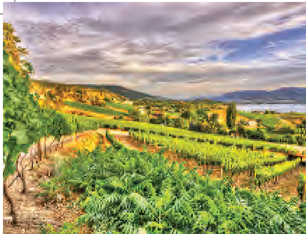
Enns夫婦現時擁有的葡萄園面積超過40英畝。