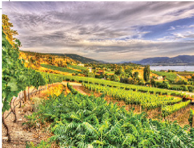
Enns夫婦現時擁有的葡萄園面積超過40英畝。